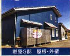
郷原G邸 屋根・外壁