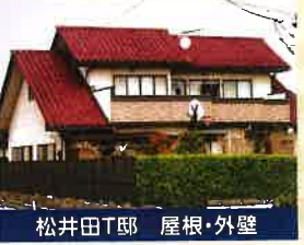
松井田T邸 屋根・外壁