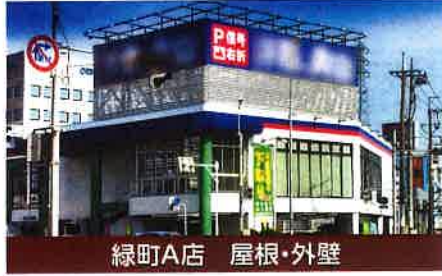
緑町A店 屋根・外壁