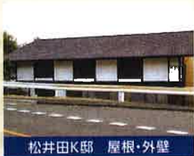
松井田K邸 屋根・外壁