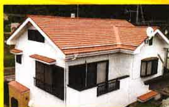
大栄総業オリジナル 屋根重ね葺き工法