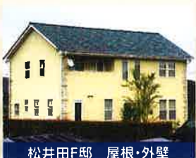
松井田F邸 屋根・外壁