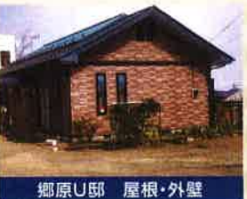
郷原U邸 屋根・外壁