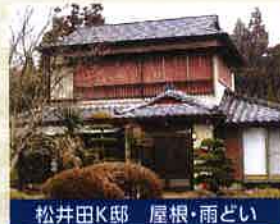
松井田K邸 屋根・雨どい