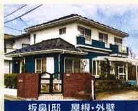
板鼻I邸 屋根・外壁