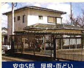
安中S邸 屋根・雨どい