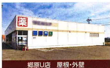
郷原U店 屋根・外壁