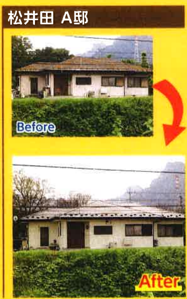
松井田 A 邸