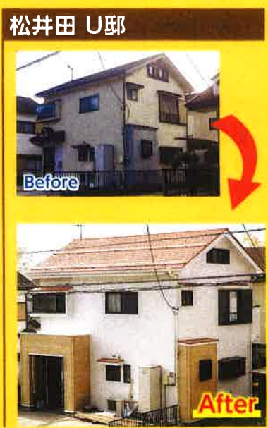
松井田 U 邸