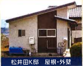
松井田K邸 屋根・外壁