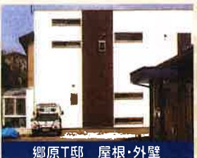
郷原T邸 屋根・外壁