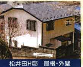
松井田H邸 屋根・外壁