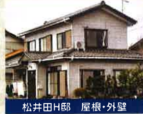
松井田H邸 屋根・外壁