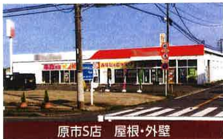
原市S店 屋根・外壁